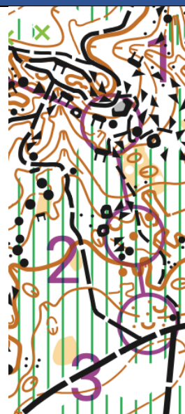
Série de trois postes en descentes, extrait T2N1