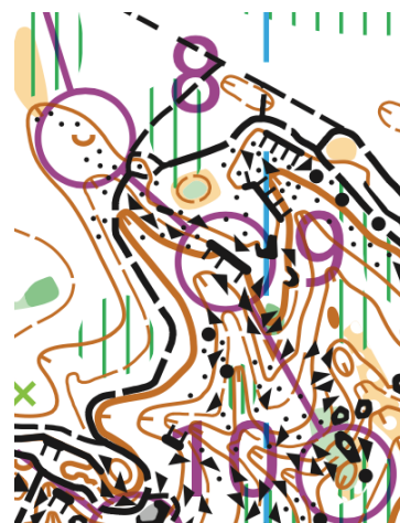
Série de trois postes en descentes, extrait T2N3